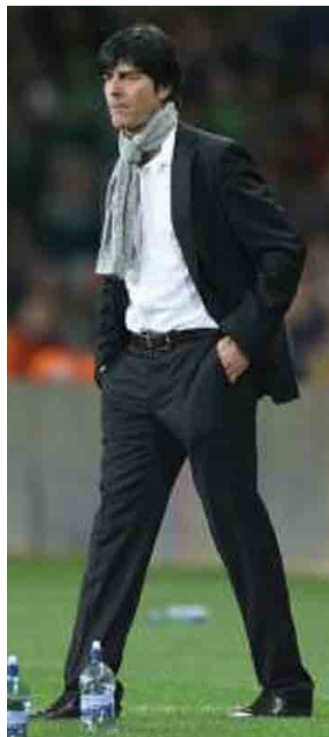
Joachim Löw trenér německé reprezentace

Olá, tak tomu říkám páni trenéři! Nejen že jsou úspěšní ve své práci, umí se i velmi dobře obléci! Kéž bychom na našich českých lavičkách viděli více takových příběhů... Je to stylové, líbivé, slušivé, prostě paráda 😊