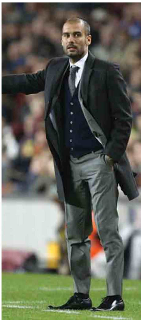
Josep Guardiola trenér FC Barcelona